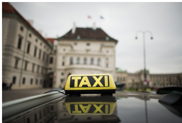
Такси возило во Виена

И покрај тоа што досега уделот на електрични возила во Виена изнесува само еден процент, во австриската престолнина покренат е пилот проект кој согласно со сите регистрирани такси возила до 2025-та година, тие автомобили ќе бидат на електричен погон. Пилот проектот предвидува воведување флексибилни станици за полнењето на тие електрични автомобили, со што ќе се олесни премиот | X | технологија, пренесува Виена Онлајн .